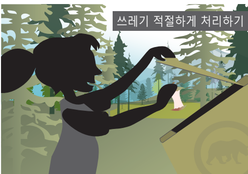
쓰레기 적절하게 처리하기