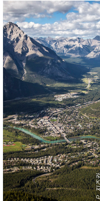
트레일, 도로, 철도, 마을을 누비는 사람들