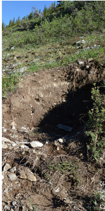
다가오는 겨울을 준비하는 데 유용한 먹거리 밀집 구역