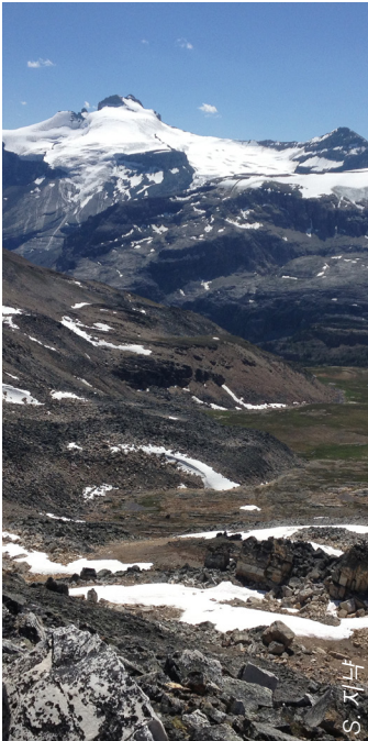
50%의 바위와 빙하 그리고 남아 있는 소중한 녹지