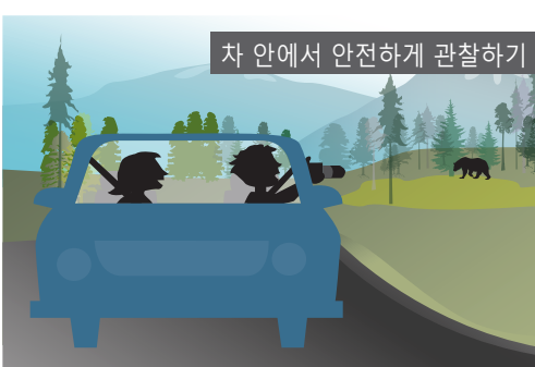
차 안에서 안전하게 관찰하기