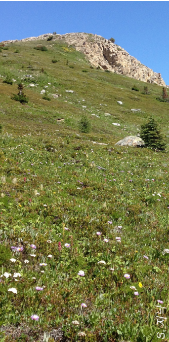
은신처 안전한 집