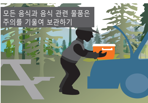
모든 음식과 음식 관련 물품은 주의를 기울여 보관하기