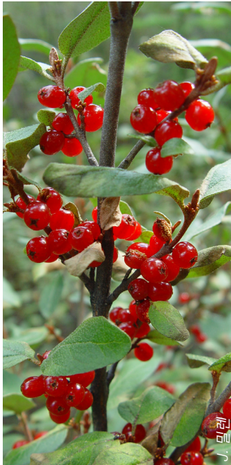
흩어진 덩굴에서 자라는 제철 먹이