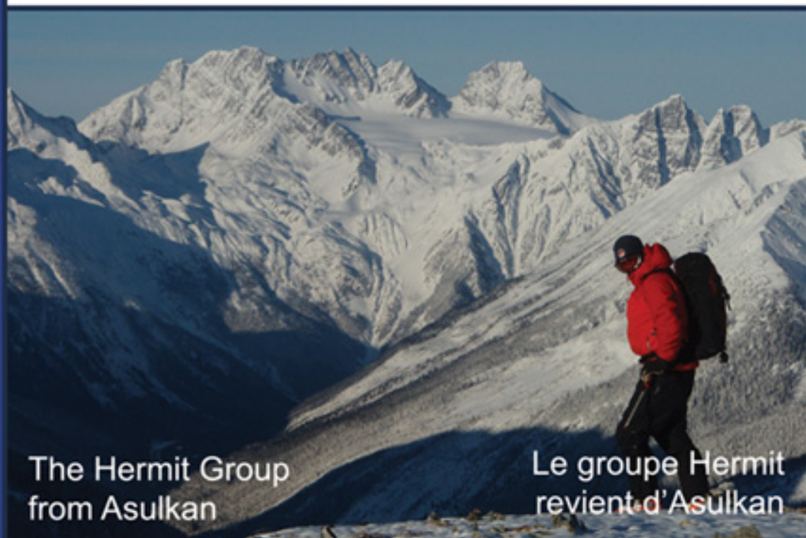
The Hermit Group from Asulkan