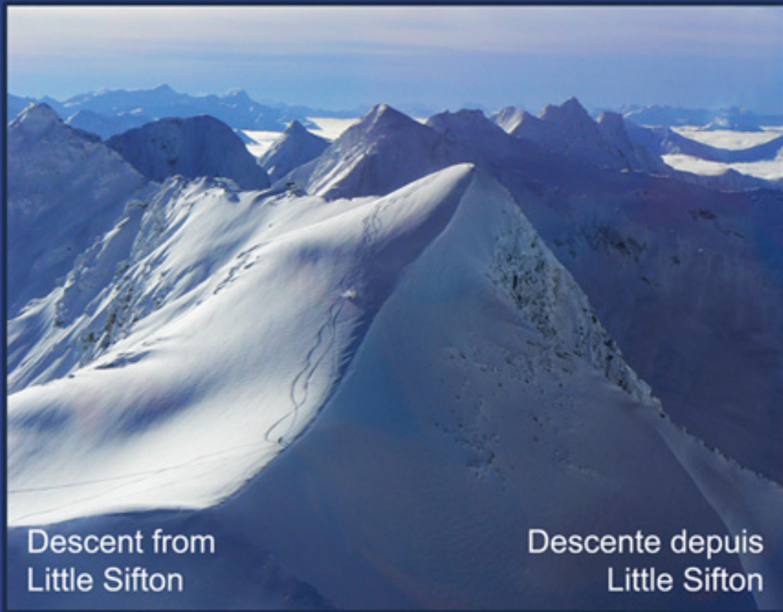
Descent from Little Sifton