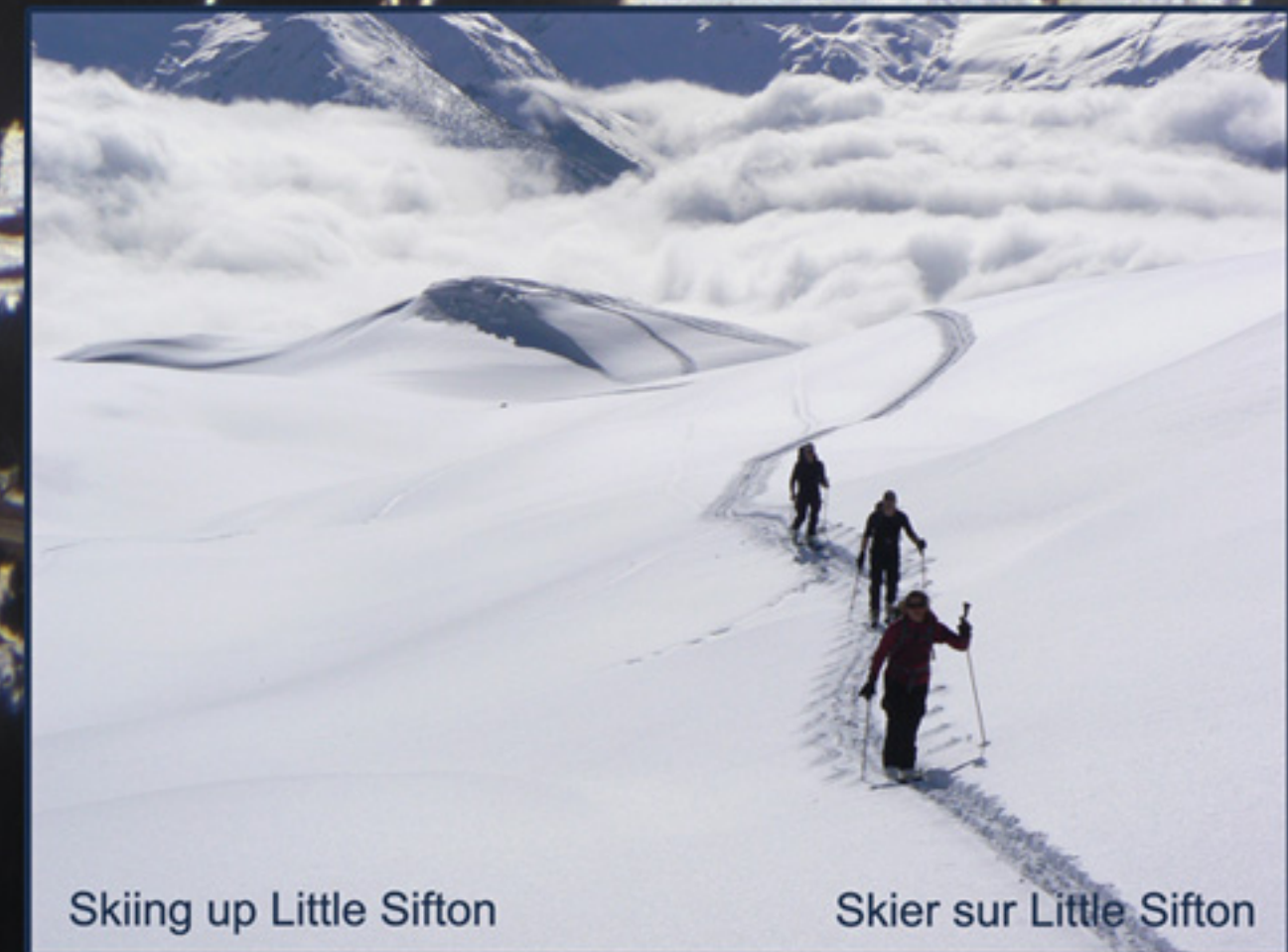
Skiing up Little Sifton