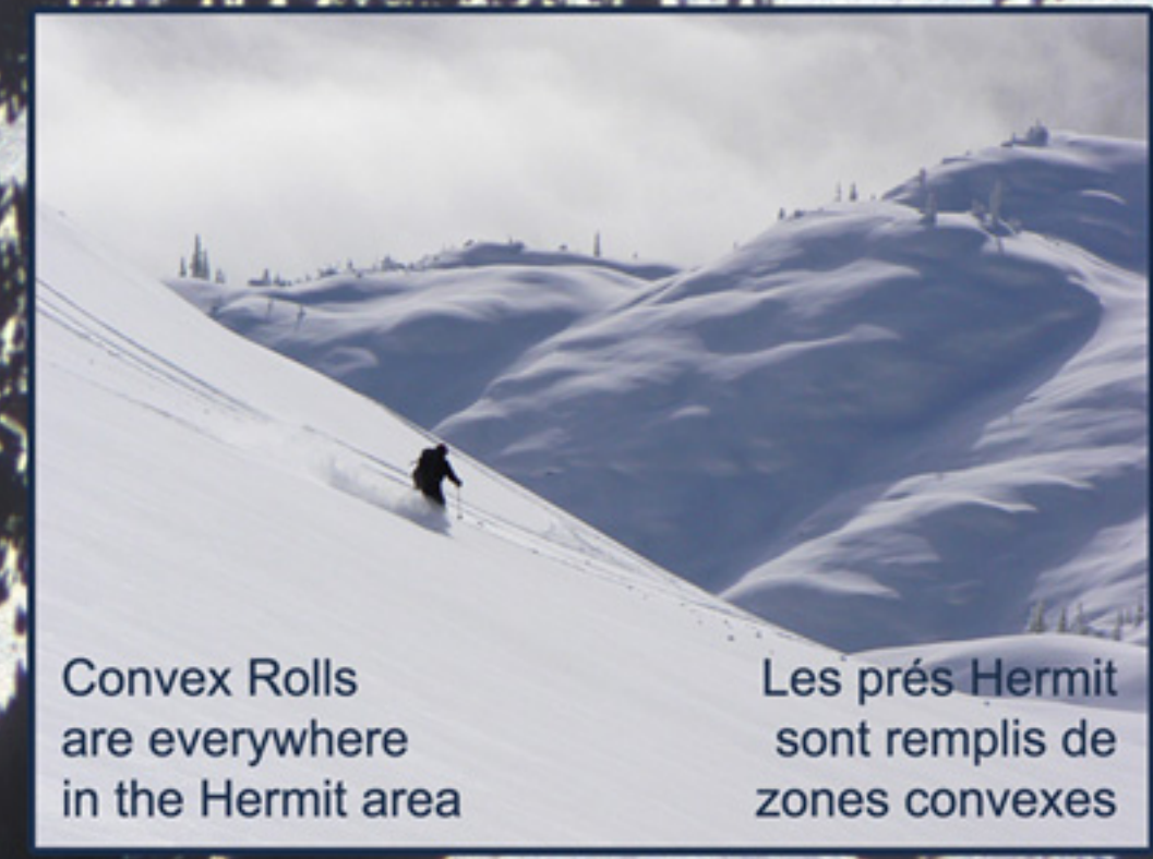
Convex Rolls are everywhere in the Hermit area