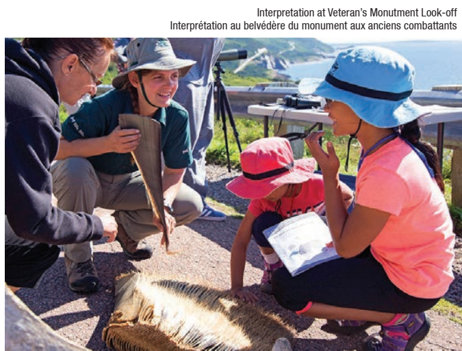
Interpretation at Veteran's Monument Look-off Interprétation au belvédère du monument aux anciens combattants

Le climat maritime et le paysage accidenté du parc, supportent une association unique d'habitats de forêts acadienne, boréale et taïga, incluant des forêts anciennes d'importance internationale.