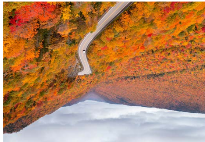
Aspy Valley Vallée d'Aepy