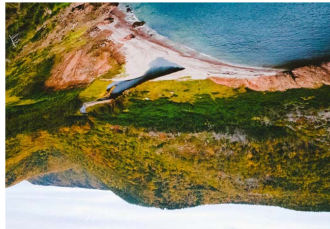
Fishing core trail and backpacking camping sentier et camping dans l'arrière-pays d'Ancie Fishing