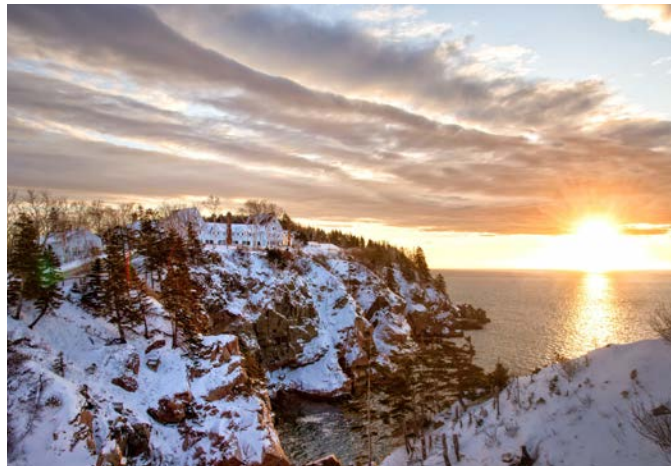
Keltic Lodge, Middle Head peninsula Keltic Lodge au péninsule de Middle Head