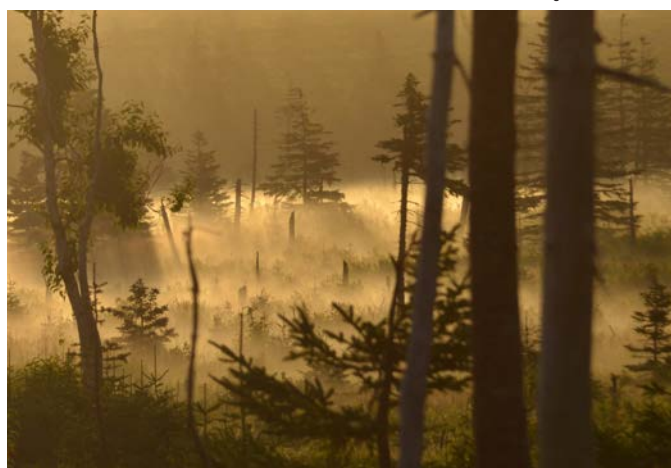
North Mountain at sunrise La montagne North à l'aube