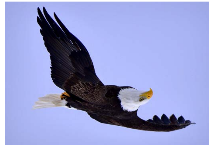
Bald eagle Pygargue à tête blanche

The cool, maritime climate and rugged landscape support a unique blend of Acadian, boreal and taiga forest habitats, including old-growth forests of international importance.